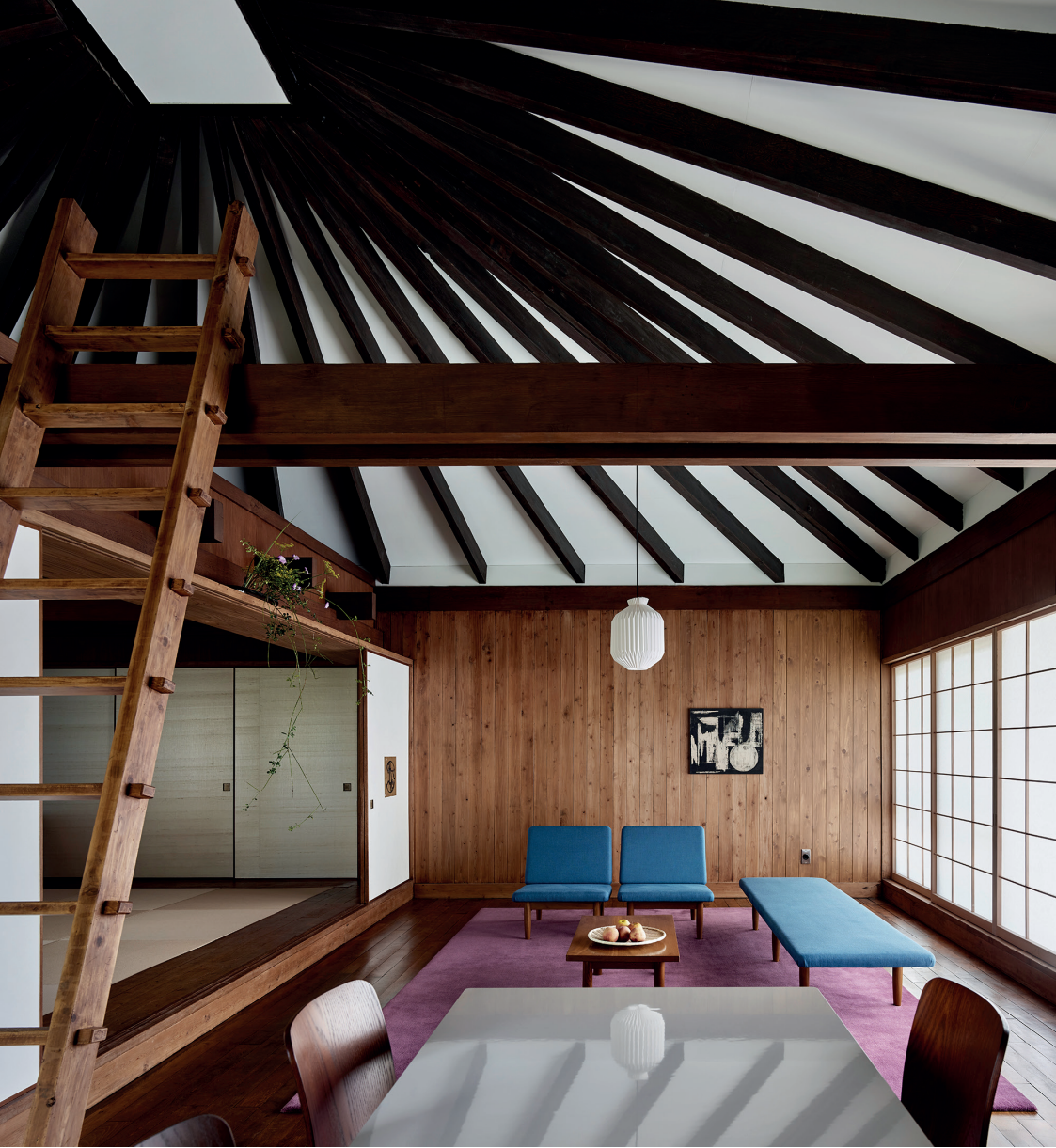
Umbrella House & Vitra Campus